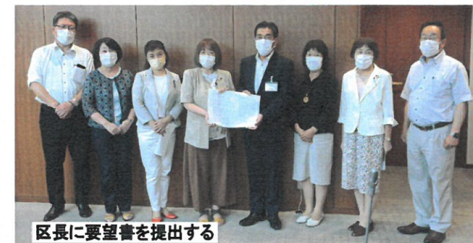
区長に要望書を提出する

日本共産党は今年の8月までに、区に14回に渡り要望書を提出、対策を求めて実現してきました。